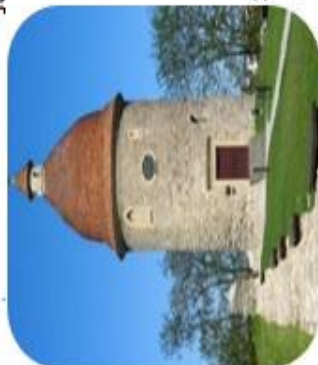
Skalica – románska Rotunda sv. Juraja