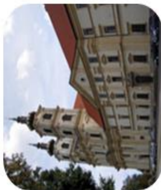
Šaštín-Stráže – Bazilika Sedembolestnej Panny Márie