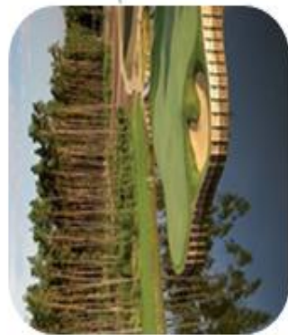
Penati golf rezort Šajdíčkove Humence