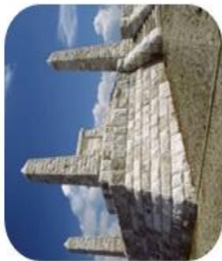
Brezová pod Bradlom – miesto posledného odpočinku M. R. Štefánika