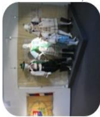
Hlboké – Pamätná izba J. M. Hurbana