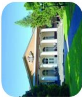
Jedinečné kúpele Smrdáky